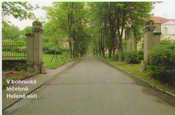
V bohnické léčebně Heleně věří

Dlouho neměla ani tušení, jaké nebezpečí na ni číhá. Vždyť jí pilulky předepisoval lékař! Nikdo ji však neupozornil, že benzodiazepiny, kam neurolog spadá, patří mezi silné návykové léky. Byla na sebe pyšná, že abstínuje, ambulantně chodila k Apolináři na skupinu léčených alkoholiků. Zázračná pilulka skvěle rozháněla chmury, jen těch pilulek muselo být stále víc.