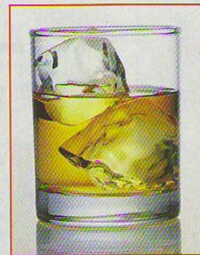
Uspávací účinky alkoholu jsou šálivé - opilecký spánek je totiž nekvalitní

V případě dlouhodobé chronické nespavosti je ale vždy vhodné navštívit lékaře, nejlépe specialistu - neurologa-somnologa.